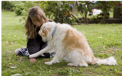
Titel: VRIENDEN, Onze hond een kindervriend

Kinderen en honden zijn een superduo als ze op verantwoorde en veilige manier met elkaar kunnen omgaan. Voor ouders en verzorgers, maar ook trainers en hondeneigenaren biedt dit praktische boek een handleiding om gevaarlijke situaties tussen kinderen en honden te signaleren en te voorkomen. Het boek geeft meer inzicht over hoe hond en kind elkaar vanuit hun eigen standpunt